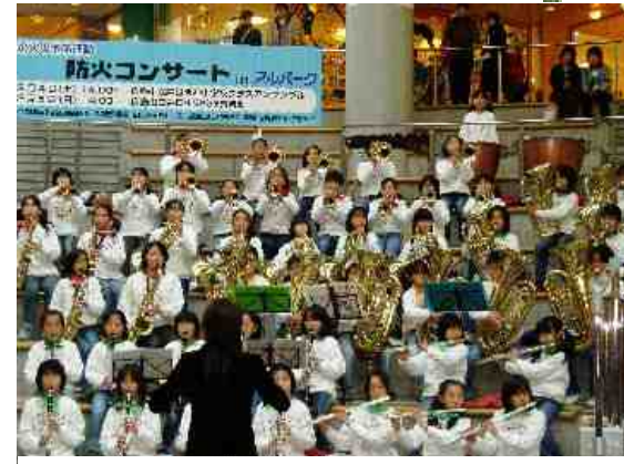
出演：井口明神小学校 プラスアンサンブル アルパーク東棟2階東広場にて

演奏に先立って、「このクラブは4、5、6年生60名の児童が週3日、放課後練習している。」と紹介されましたが、これだけ種類の多い楽器の指導はどのようにされてみえるのか、興味のあるところです。