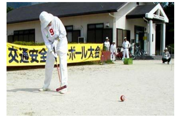
ゲートボールも交通安全もルールが大切

高齢者の交通事故防止は、「秋の全国交通安全運動」の重点項目の一つでした。この運動の初日に当たる9月21日、西部埋立第二公園(西区井口明神二丁目)で西区ゲートボール連合が主管する第17回交通安全ゲートボールが開催されました。競技の途中に交通安全○×クイズがあり、参加者はゲートボールと同様、交通ルールの大切さを改めて確認しました。