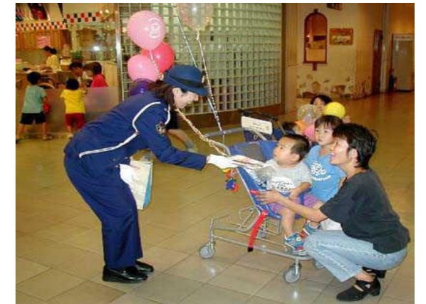
交通事故には十分気をつけてください

増える交通死亡事故に対し、10月12日広島県知事は、「交通死亡事故非常事態宣言」を発表しました。これを受けて、広島西交通安全協会と広島西交通安全運動推進隊では、広島西警察署、広島市西区役所などと合同で、同日の午後5時から、西区草津新町二丁目のアルパークで街頭キャンペーンを実施しました。参加した約40人は宣言文の入った啓発物を配布して、交通安全を呼びかけました。