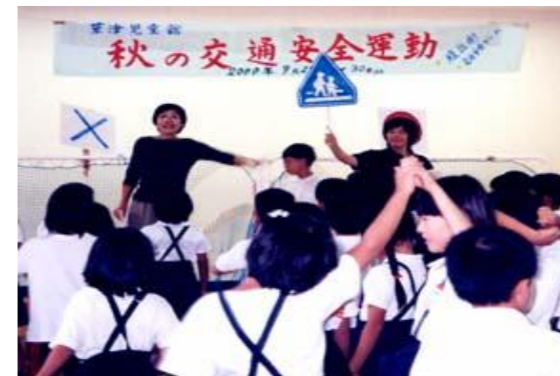
交通標識を使って交通安全クイズ

「秋の全国交通安全運動」期間中の9月29日、草津児童館(西区草津東二丁目)では、子どもたち約70人が参加し、腹話術とクイズで楽しみながら交通ルールを学びました。児童館の指導員が作成した交通標識を取り入れた交通安全クイズに、子どもたちは二人一組になって、問題が○か×か、わいわいがやがや答えていました。