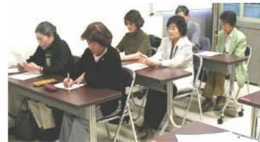
説明に聴き入るみなさん