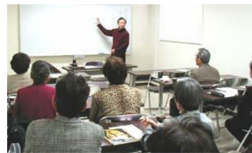
ボードに要点を書きながらの講演