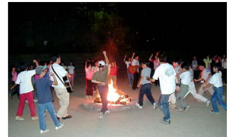
↑ キャンプファイヤー