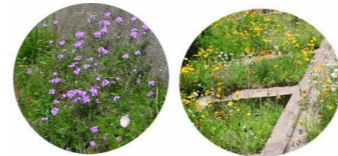
散策の道、道でかれんで色とりどりの花々が迎えてくれます。