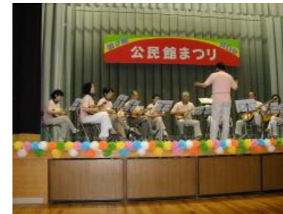
ギター&マンドリン「MINARGA」の皆さん

18日朝から晴天に恵まれ、町民の方々も晴れ晴れした心もちで三々五々公民館まつりのセレモニーに参加するため訪れて来ました。公民館まつりセレモニーには多数の来賓の方々をお迎えし、午前10時に来賓の方とともに公民館まつりの看板が除幕され、まつりがオープンしました。