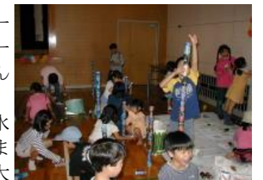
空き缶の積み上げに熱中

公民館の駐車場ひろばでは、バザーが開店されました。販売のメニューは、洋菓子コーナーや天ぷらうどんのほか、手づくりのおむすび弁当、春のちらし寿司、カレーライス、水ギョウザなどが販売されました。また、花の即売会、2日間にわたり大勢のお客さんで賑わいました。