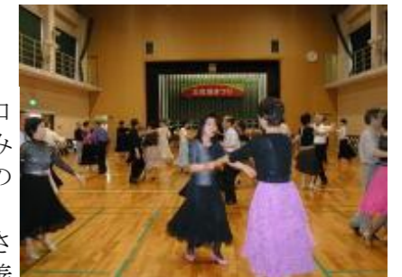
鈴が峰社交ダンス同好会ほかの皆さん

鈴が峰公民館まつり恒例の社交ダンスパーティーが催され、広島市近郊の公民館サークルおよび社交ダンス愛好の善男善女が多数参加され、盛大に一夜を過ごしました。