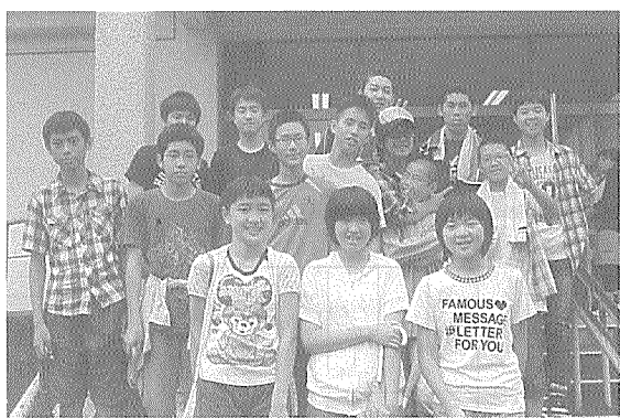
庚午中ボランティアの面々