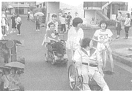
車イス押すの 楽しいかも!

九時三十分出発、それぞれの町民の方も大勢集り町点検が始まりました。あちこち歩道と車道との間のデコボコ、段差があり車椅子を押していて不安な気持ちになりました。毎年少しづつ改善されているもののまだまだデコボコ道や損傷した多くの個所が見つかりました。高齢者や障害者もつた方、幼児や子供たち又みんなの為に安全で安心して歩ける町になればと願っております。