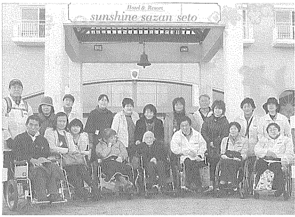
福祉バスグループ