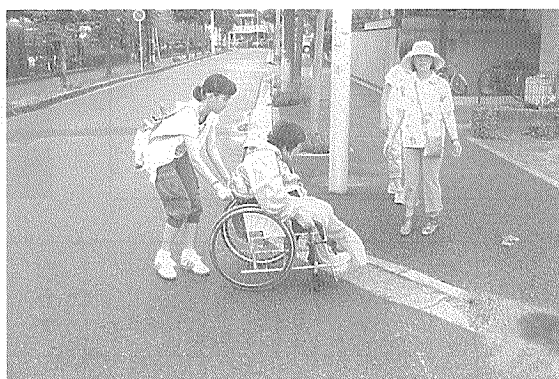
ダイジョーブかな? ゆっくりやってね