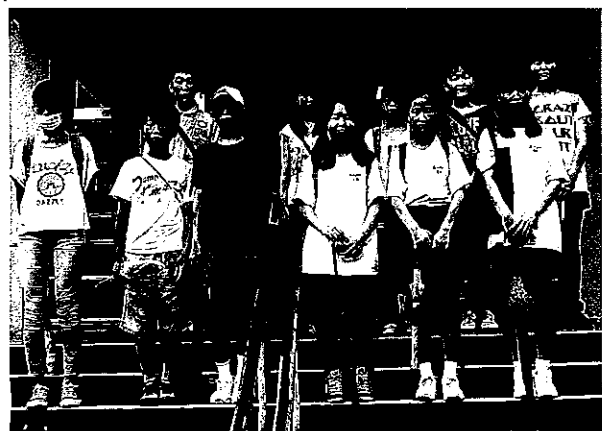
庚午中ボランティアさん、この後各町に分れて