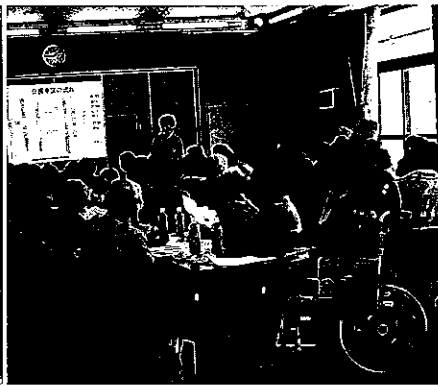
包括支援センターによる研修会