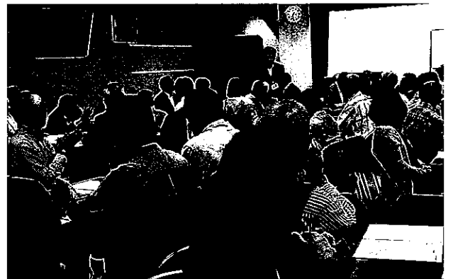
この地域に暮らす喜びを～社協総会

続いて二十五年度事業計画・予算案の提案があった。質疑応答の後、原案通り承認された。その後「連合町内会」「再開発連絡協議会」の総会に入りそれぞれ原案通り承認された。総会が終わり続いて懇親会が催され予定通り午後九時に散会した。