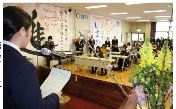
表彰式後の朗読会の様子