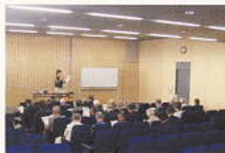
環境講座の開設 平成20年10月9日(安芸区)