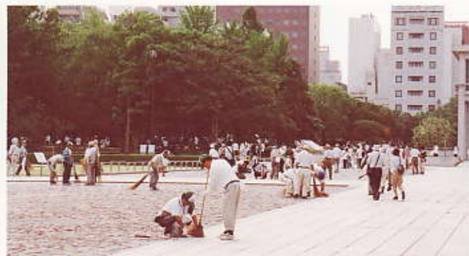
平和記念公園一斉清掃 平成20年7月31日(市公衛協)