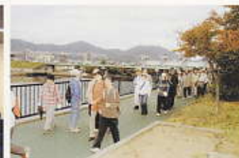
健康ウォーキングのつどい 平成20年11月9日(東区)