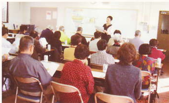
健康教室の開設 平成20年11月20日(南区青崎地区)

各学区(地区)毎に健康教室・環境講座を開設し、専門講師を招くなどして知識の普及・実践化を図る。