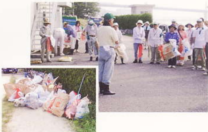
「太田川クリーンキャンペーン」平成20年7月21日(西区己斐東学区)