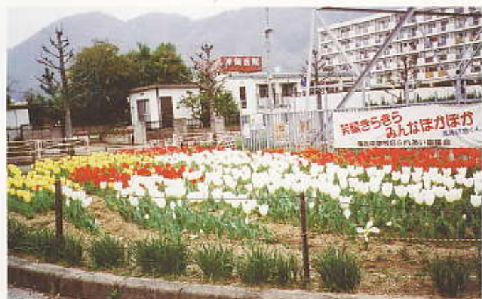
町をきれいにする運動 平成20年4月13日(安佐北区真島学区)