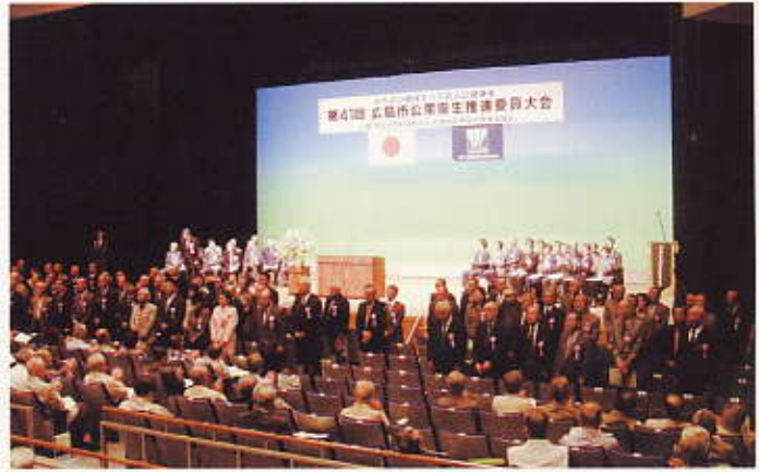
推進委員大会 平成20年10月17日(西区民文化センター)

広島市公衆衛生推進委員としての自覚を高め、地区の公衆衛生活動(コミュニティづくり)の推進と、併せて永年この活動に寄与した功労者をたたえ表彰式を行い、一層の発展を図るため大会を開催する。