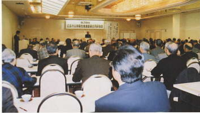
合同研修会 平成21年1月22日(広島サンプラザ)