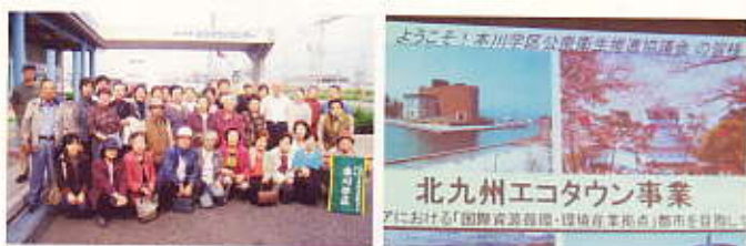
施設見学（北九州市エコタウンセンター）