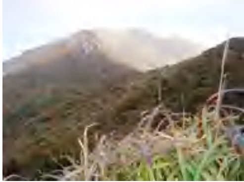
西千里ヶ浜から星生山