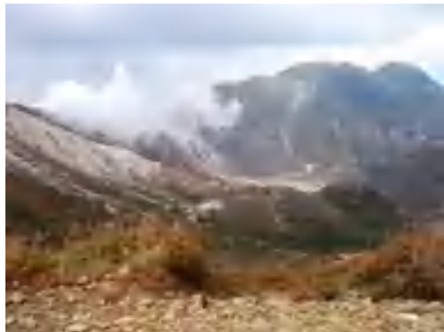
久住分かれから硫黄山