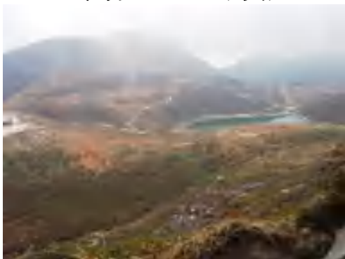
中岳から御池・久住山