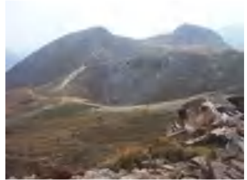
久住山から天狗ヶ城と中岳