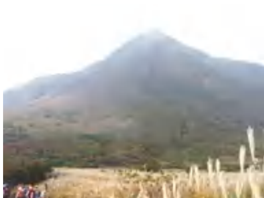
坊ガツルから平治岳