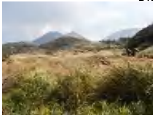
雨が池から三俣山