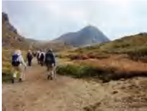
西千里ヶ浜から天狗ヶ城