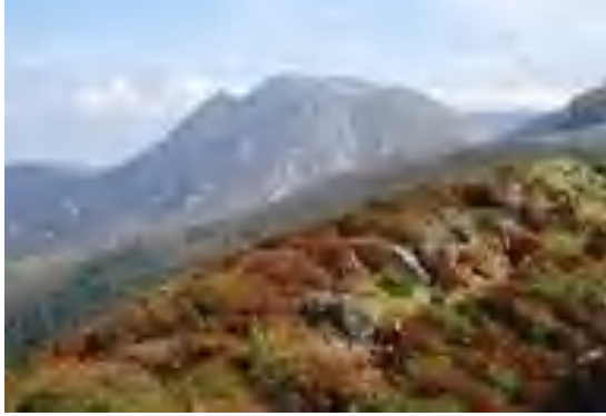
沓掛山から三俣山