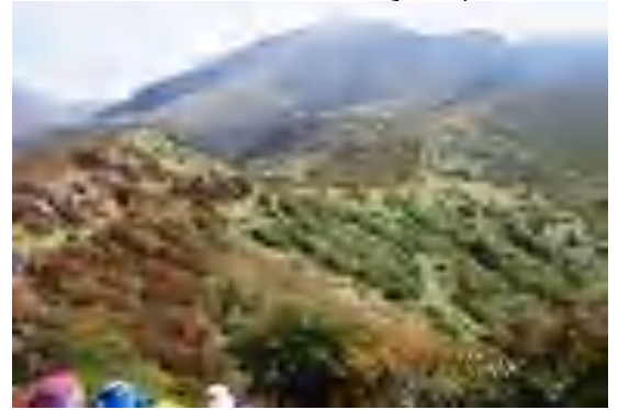
沓掛山から星生山