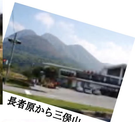
長者原から三俣山